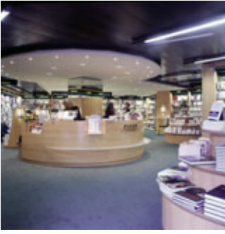
Au chien bleu, librairie jeunesse à Genève