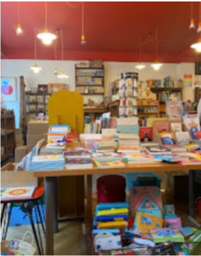
L'alchemist à Carouge